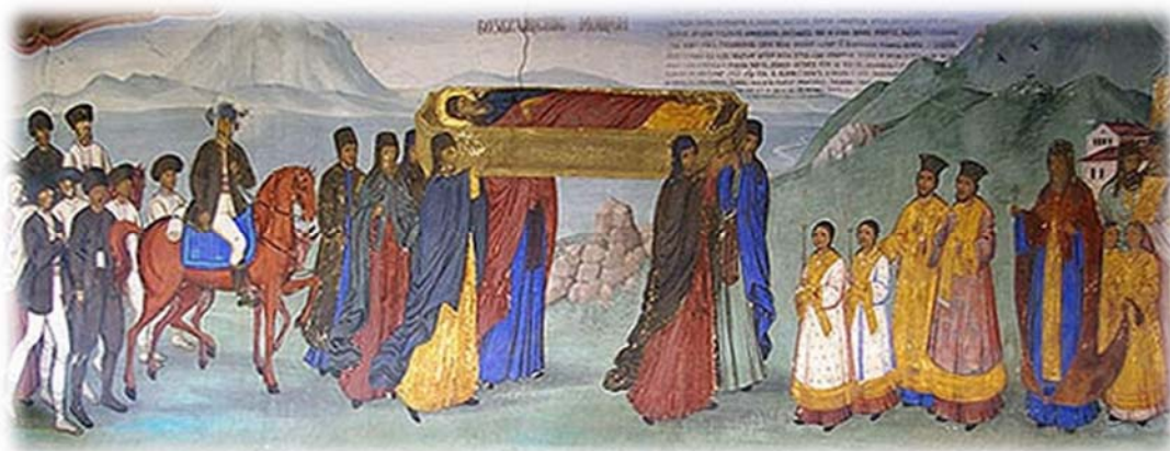
Пренасяне мощите на св. Йоан Рилски от Велико Търново в Рилския манастир. Стенопис от Никола Образописов

състояние сградата е просъществувала до XI в. Именно тогава, кръглата зала и предверието към нея от запад са били преустроени, а прозорците в подкуполния барабан са намалени по размери.